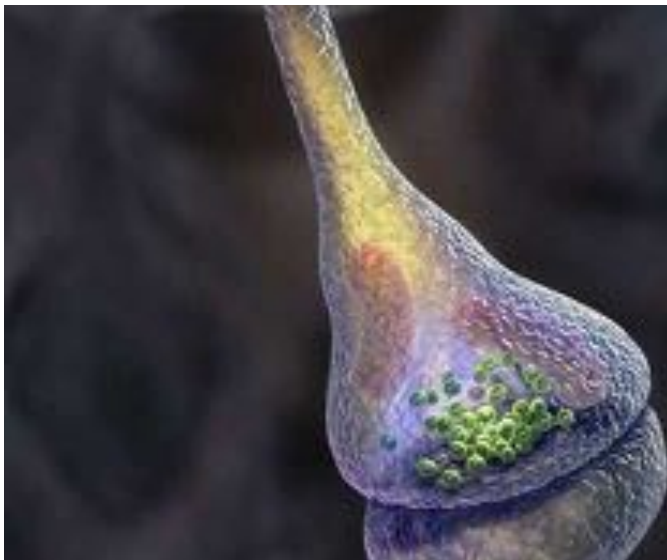
Figure 1 : Synapse

La logique binaire des ordinateurs, aussi performante soit elle, est en revanche à ce jour incapable de raisonner. C'est pourquoi les informaticiens en viennent à utiliser des systèmes à logique floue et auto-évolutive (appliqués aussi bien à l'électroménager qu'aux réseaux neuronaux artificiels) plus aptes à saisir paradoxes et notions de sens commun. Il y a donc des paliers du réel, que le monde du vivant ne transgresse pas, mais au contraire stratifie. Le système nerveux permet ainsi une transmission rapide et hautement structurée des signaux. La communication intercellulaire est réalisée par l'intermédiaire de jonctions synaptiques électriques ( gap junctions ) et surtout chimiques qui seront, selon le médiateur et les perméabilités membranaires en jeu, tantôt excitatrices tantôt inhibitrices.