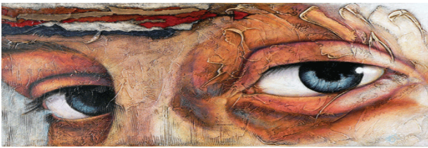
Figure 2 : Autisme

Tout est donc dans le regard que l'on porte 17 .