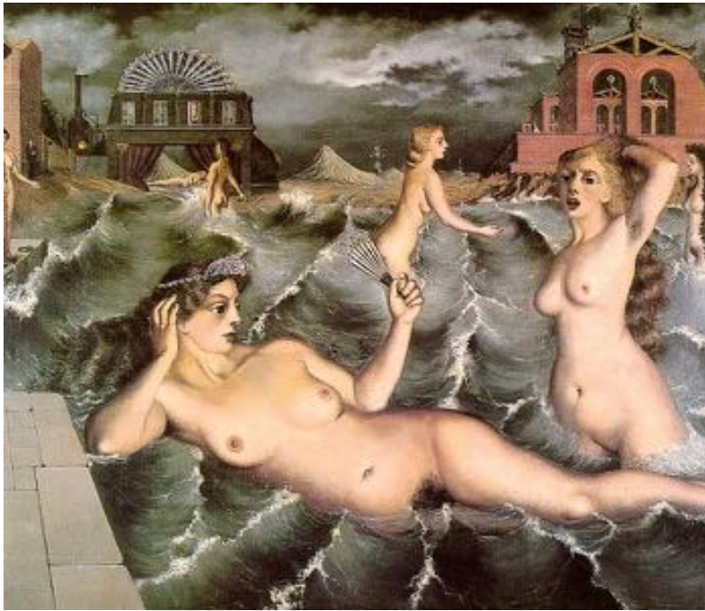
Figure 4 : Le rêve

synaptiques au niveau du cortex cérébral, ce qui aurait pour conséquence d'estomper la trace du rêve inconscient au réveil. Mimés par des réseaux neuronaux, ces approches montrent que l'inversion de la fonction d'apprendre ( reverse learning ) augmente la performance grâce à l'effacement spatial et temporel de certains réseaux qui libèrent de la place dans la mémoire encombrée du cerveau (Hopfield et al., 1983).