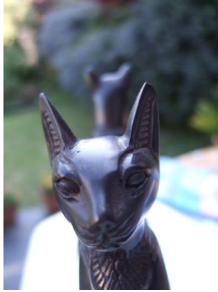
« Le chat de Schrödinger »

temps est déterminé dans notre cerveau par la flèche entropique, alors ces deux lois seraient conciliables et élimineraient le paradoxe temporel apparent.